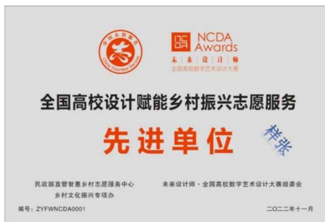
全国高校设计赋能乡村振兴先进单位牌匾